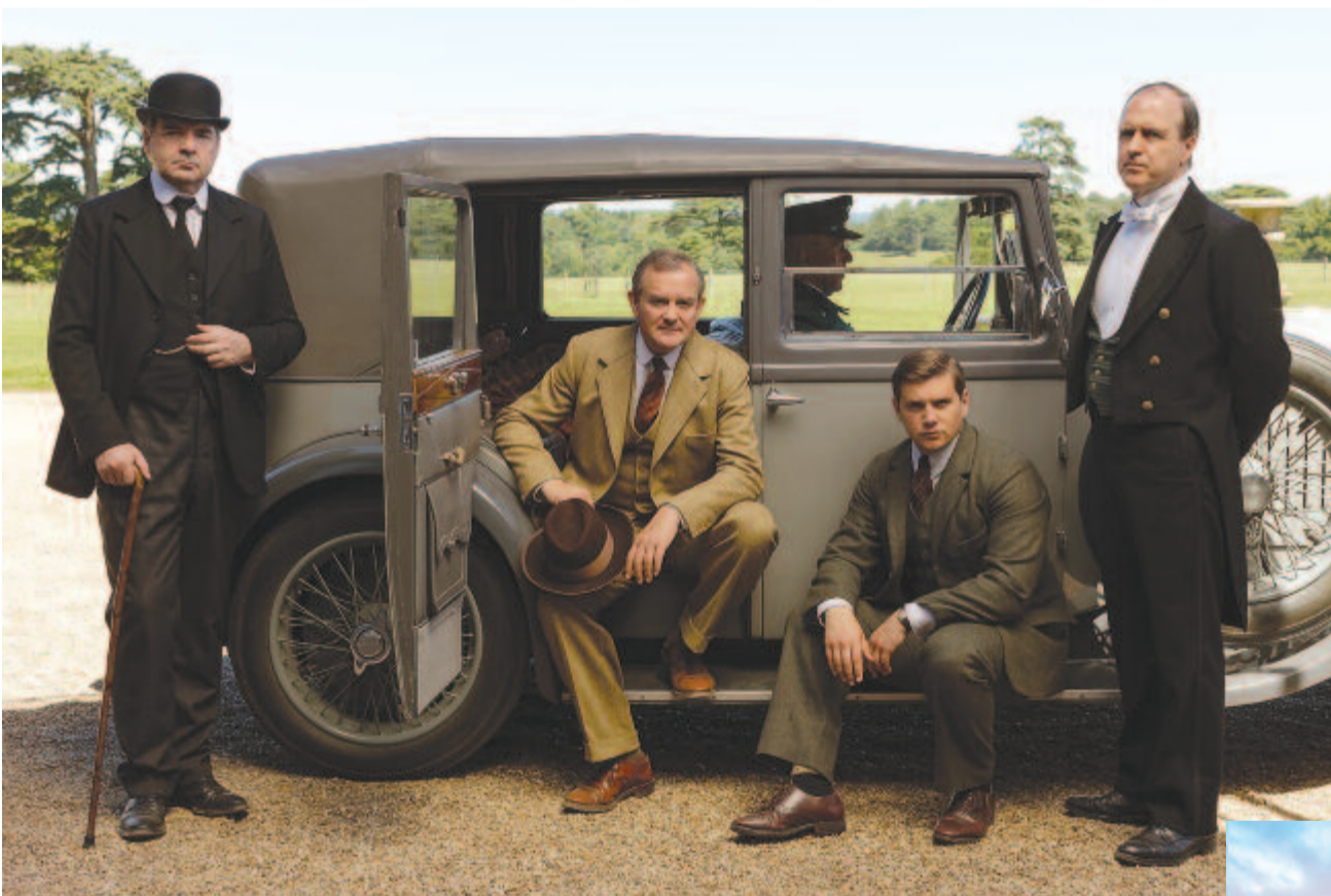
Jelenet a sorozatból

Elkezdődött a Downton Abbey tévésorozat nyomán készülő játékfilm forgatásának előkészítése – értesült a The Daily Telegraph a sorozat egyik szereplőjétől.