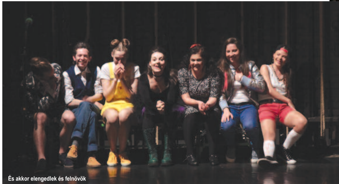
És akkor elengedlek és felnövök